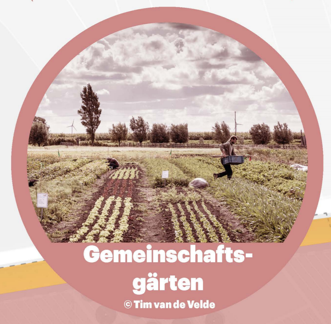
Gemeinschaftsgärten © Tim van de Velden