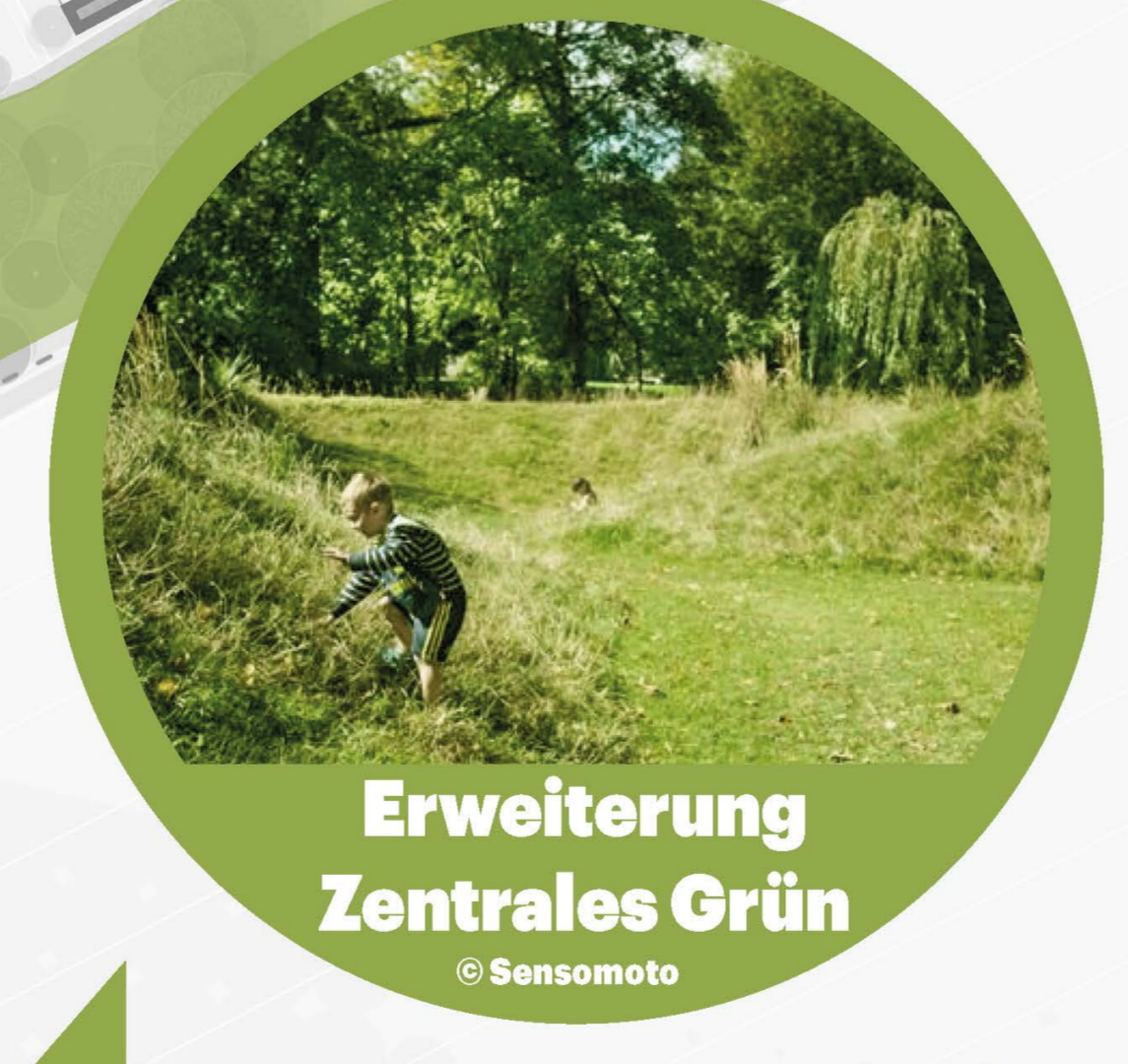
Erweiterung Zentrales Grün © Sansonoto