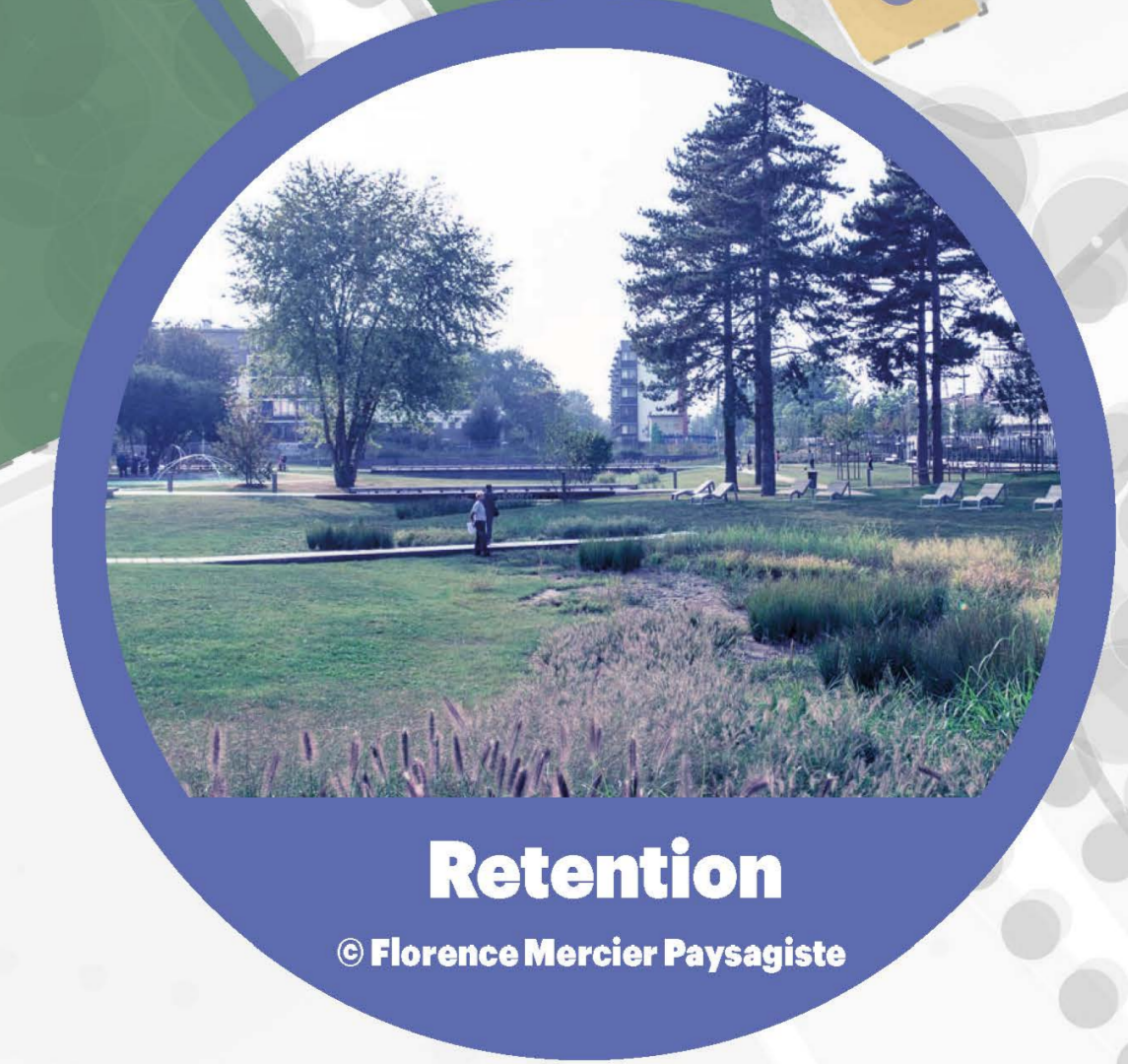
Retention © Florence Mercier Paysagiste