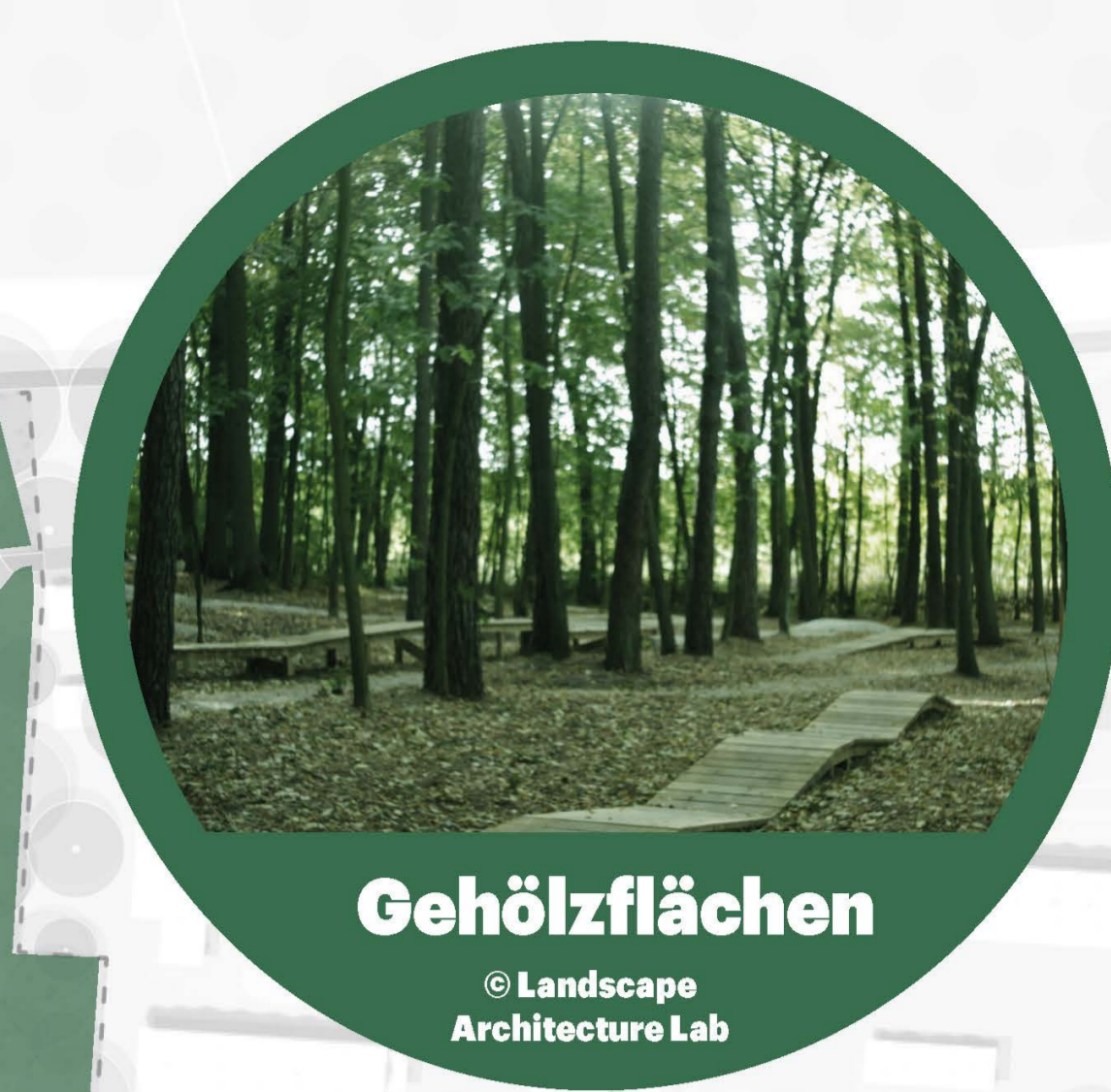
Gehölzflächen © Landscape Architecture Lab