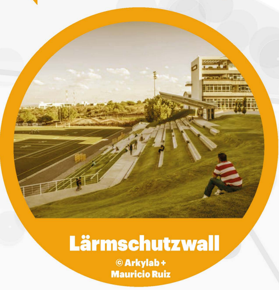
Lärmschutzwall © Andy Jaksch Hanspeter Rutz

Schallschutzmaßnahmen für die Wohnanlagen