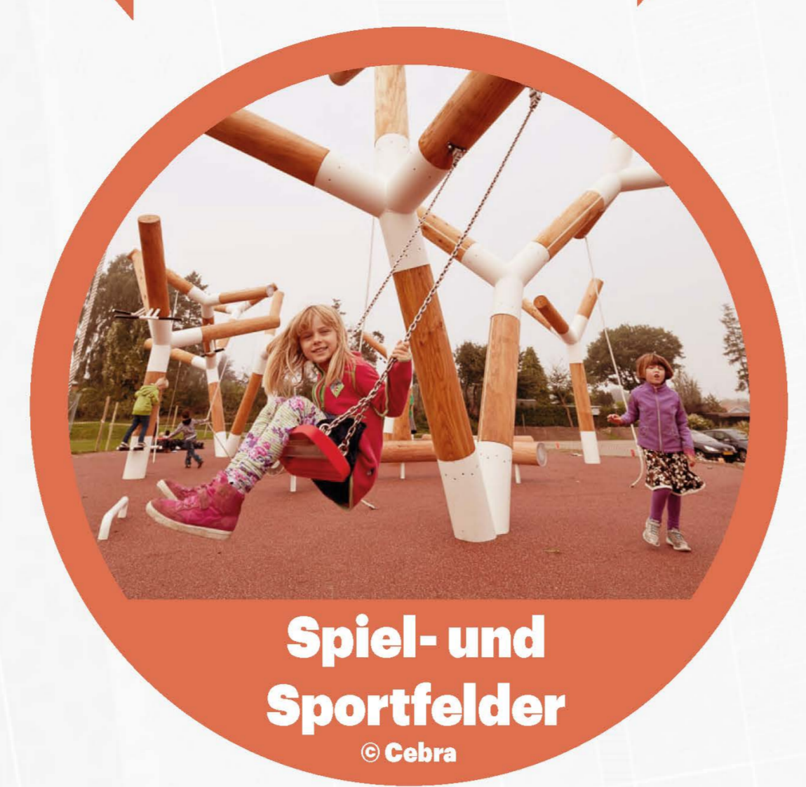
Spiel- und Sportfelder