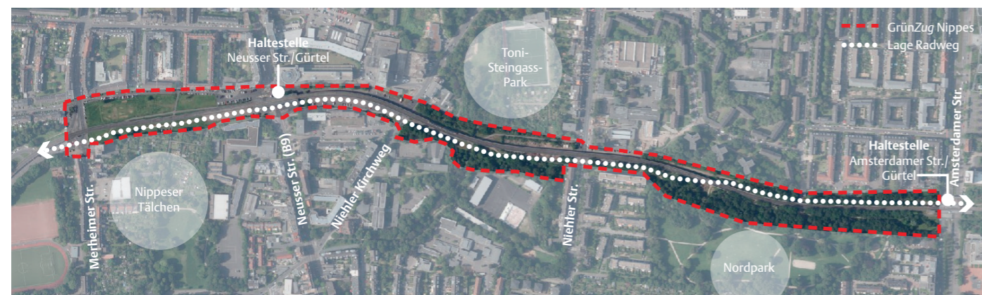
GrünZug Nippes (ohne Maßstab) (Stottrop Stadtplanung, Stand August 2021)

* Nicht genug Platz? Auf dem Beteiligungsportal können Sie längere Texte unterbringen.