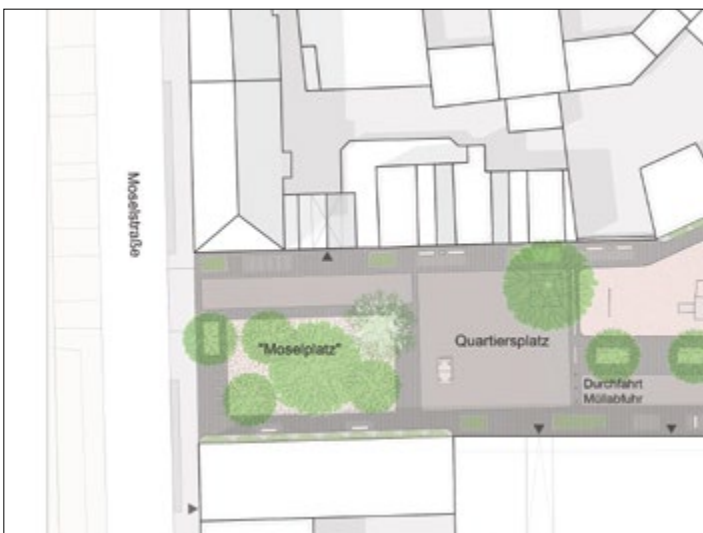
Zwischenstand des freiraumplanerischen Konzeptes

Auf dem angrenzenden Grundstück soll durch eine geplante Baulückenschließung neuer Wohnraum im öffentlich geförderten Wohnungsbau entstehen. Die sich daraus ergebene Möglichkeit soll genutzt werden, das Plangebiet den Bewohnerinnen und Bewohner des Quartiers öffentlich zugänglich zu machen und Wohnumfeldqualitäten für das Quartier zu schaffen. Ziel ist, gemeinsam mit den Bewohnerinnen und