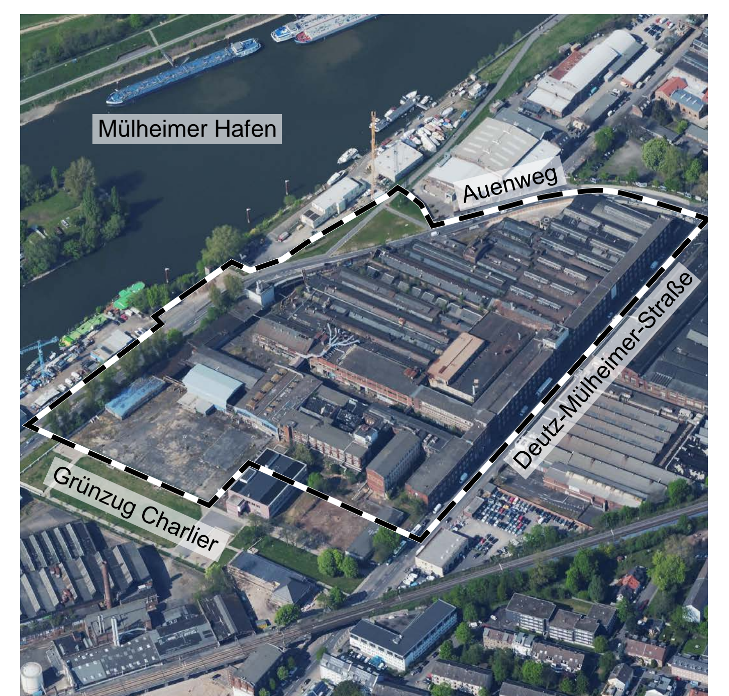
Schrägluftbild mit Geltungsbereich des Bebauungsplans

Diese Informationen und weitere Auskünfte finden Sie auch auf den Internetseiten der Stadt Köln unter www.beteiligung-bauleitplanung.koeln oder www.meinungfuer.koeln